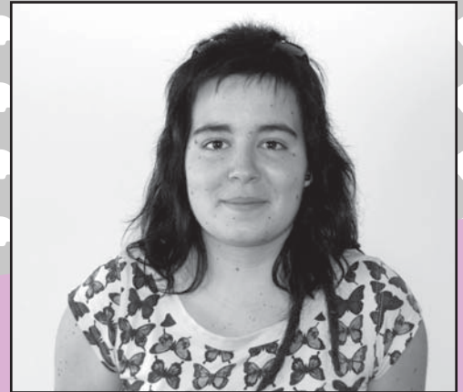
Coral i "Dover"

poc car per les vacunes, els xampús, les pastilles per a desparasitar-lo, el menjar... No crec que les mascotes s'acaben pareixent als seus amos. Sempre me la porte amb mi de vacances.